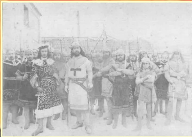
Un grupo de amigos del Casino Alcoyano en 1882

Para defender la villa de Alcoy del ataque sarraceno que en la primavera de 1276 proyectaba el caudillo árabe Al-Azraq, el rey don Jaime de Aragón, dueño y señor natural de nuestras tierras, ordenó que desde Játiva salieran para guarnecer la plaza cuarenta caballeros que junto a los habitantes alcodianos deberían enfrentarse a los atacantes. No se sabe bien si los jinetes aragoneses llegaron o no a tiempo de la escaramuza, o si, por el contrario, cuando ellos arribaron a Alcoy, ya el bravo milite sarraceno había muerto asaetado y los alcoyanos con Mosén Torregrosa al frente —y con el supremo auxilio de San Jorge— habían puesto en fuga a los ofensores.