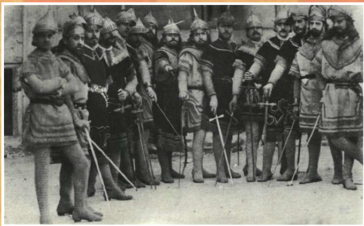
Algunos de los 40 Caballeros del Rey Conquistador en 1885

1924 es el primero y el último año. Los 40 caballeros del Conquistador a partir de este año no han vuelto a entrar en Alcoi.